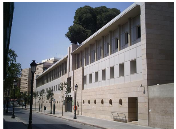
ENTRADA AL JARDÍN BOTÁNICO